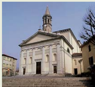
Lecco, Basilica San Nicolò

> Monastero del Lavello - Via Padri Servitivi 1