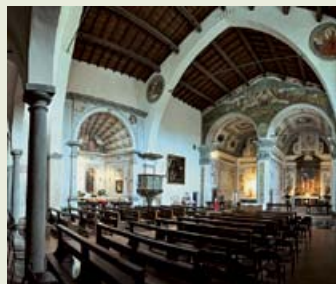
Calolziocorte, Monastero del Lavello